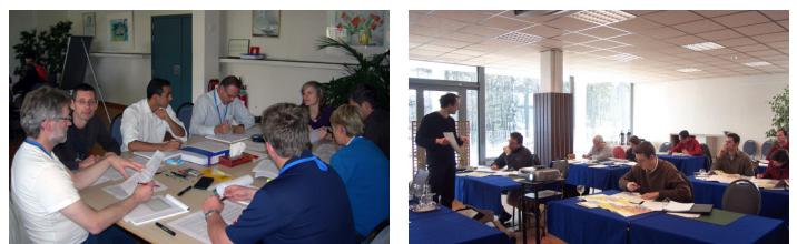
Nationale en internationale opleidingen.

Energiebeleid , waaronder de ontwikkeling en beoordeling van energiemogelijkheden en aspecten van het rechtvaardigen van nucleaire technologie in het kader van duurzame ontwikkeling.