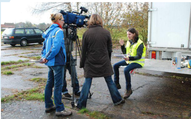
Experimenten met media voor onderzoek rond risicocommunicatie.