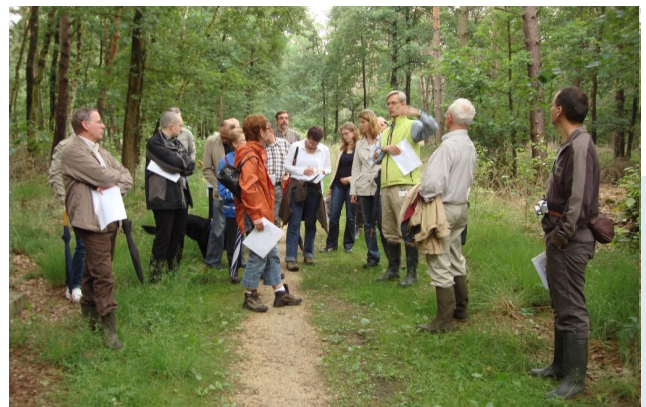
Participatie van betrokken partijen.

Beleid van radioactief afval , bv. het bestuderen van het proces van het betrekken van de lokale gemeenschap en andere stakeholders in complexe besluitvorming omtrent locatievraagstukken voor de berging van radioactief afval.