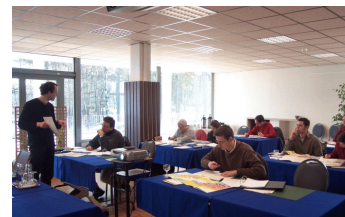
Cours de formation nationaux et internationaux.

Afin de partager nos connaissances, notre savoir-faire et les rendre accessibles à un public plus large, y compris les chercheurs, les décideurs et les différents acteurs du nucléaire et non nucléaire, nous sommes activement impliqués dans des programmes d'éducation et de formation, couvrant des sujets tels que l'éthique; l'évaluation de la technologie; l'impact social, économique et psychologique des situations d'urgence radiologique; et la communication.