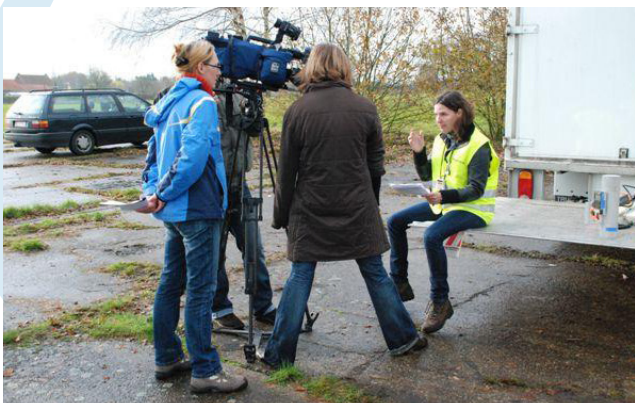
Expériences avec les médias pour la recherche de communication des risques.