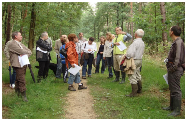
Participation des parties prenantes.

La gouvernance des déchets radioactifs , centrée autour de l'implantation des sites de stockage des déchets radioactifs et du processus de participation des collectivités locales et d'autres parties prenantes dans la prise de décisions.