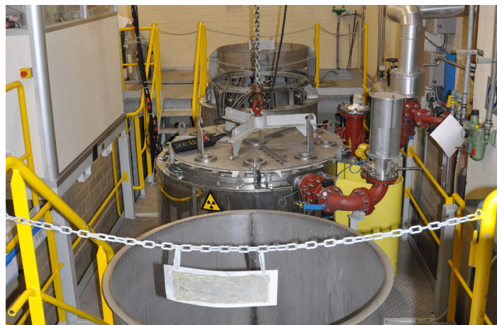
La décontamination chimique de pièces métalliques (MEDOC).

Récemment, notre mission d'assainissement s'est étendue au démantèlement d'expériences et d'équipements non nucléaires contenant des produits dangereux ou toxiques.