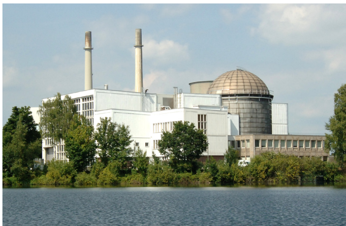
Vue extérieure du Belgian Reactor 3 (BR3).

Le projet de démantèlement de BR3 a débuté par la décontamination de l'ensemble du circuit primaire et des circuits y attenants et s'est poursuivi par le démantèlement des composants internes et de la cuve du réacteur. Le démantèlement de l'ensemble des composants du circuit primaire et du réacteur est terminé. Pendant cette phase du projet, une attention particulière a été portée à la réduction maximale de la production de déchets via des technologies de décontamination et des techniques de recyclage.