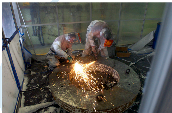
Démantèlement du Belgian Reactor 3 (BR3) dans une cabine ventilée.

Le groupe d'expertise a également développé aux échelles laboratoire et pilote divers procédés de traitement d'eaux usées et de déchets contenant du tritium ( H^3 ), de Na/NaK contaminé ainsi que de récupération de Bore des eaux de refroidissement de réacteurs de puissance de type PWR. Il a été récemment chargé d'assainir les expériences et installations non nucléaires contenant des matières toxiques ou dangereuses.